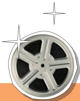
Gregor Mendel a tajemství hrášku Websterovi ve filmu 24. 9. 14:00 Malý sál, Měšťanská beseda

Na filmové dobrodružství bude možné navázat výrobou vlastního pavoučího kamaráda, který dětem ve formě brože poslouží jako talisman pro štěstí nebo jim dodá odvalu k nečekaným dobrodružstvím. Workshop, který bude trvat zhruba 30 minut proběhne bezprostředně po filmu a vstup na něj je zdarma.