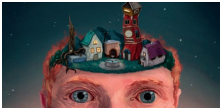
Tmání 24. 9. 11:00–16:30 Saloněk Primátor, Měšťanská beseda