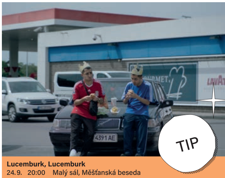
Lucemburk, Lucemburk 24.9. 20:00 Malý sál, Měšťanská beseda