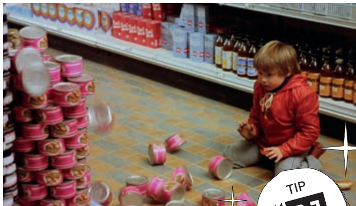
Grand Prix 24. 9. 20:30 Velký sál, Měšťanská beseda Panelstory aneb Jak se rodí sídliště 24. 9. 17:30 Studijní a vědecká knihovna

manželky jednoho z nich. Filmová lahůdka pro ty, kdo mají rádi komedie s přesahem. A kdyby vám sociálního tématu namixovaného s komedií bylo málo, můžete dnes vyrazit i na klasiku, Panelstory Věry Chytilové z roku 1979.