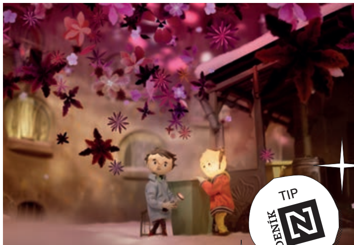
Tonda, Slávka a kouzelné světlo

Slávce a z prestižního festivalu animace v Annecy si už stihl v červnu odvézt Cenu poroty. Vydejte se s jeho hrdiny na dobrodružnou výpravu za záhadnými chomáčky tmy a nezapomeňte doma děti.