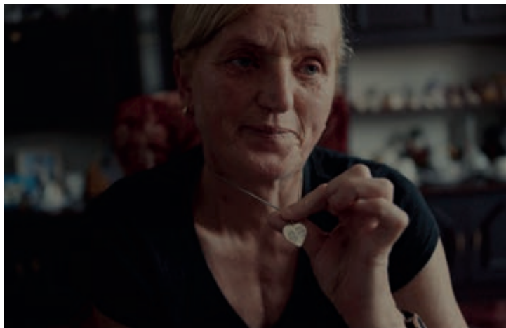
Kuciak: Vražda novináře

rozhovorů i dosud nezveřejněných záběrů rozplétá politicko-mafiánské vztahy, které k odpornému zločinu vedly. I když si možná myslíte, že celý případ dobře znáte z médií, snímek Kuciak: Vražda novináře jej přehledně rekonstruuje a zasazuje do nezbytných souvislostí. Z filmového festivalu v Zurichu si roku 2022 odvezl zvláštní uznání poroty.