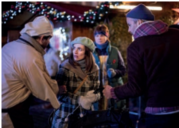
Bomba 21.9. 15:00 Dům hudby