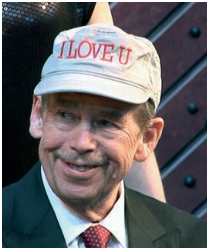
Tady Havel, slyšíte mě? 21.9. 20:00 Dům hudby

V roce 2009 se Václav Havel dotázal dokumentaristy Petra Jančárka, zda by nechtěl nasnímat zbytek jeho života. Rozhodnout se mu údajně trvalo asi půl vteřiny. Výsledkem jejich tříletého setkávání je necelou hodinu a půl dlouhý dokument, který vznikl z více než pěti set (!) hodin natočeného materiálu. Zatímco dokumentární hit Občan Havel představil prvního českého prezidenta především jako politika, snímek Tady Havel ,