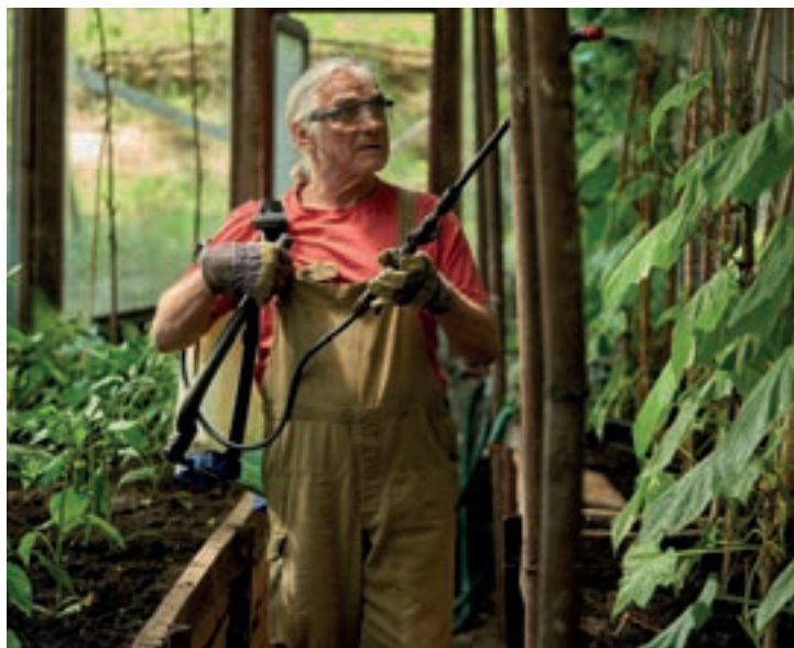
Zahradníkův rok 21.9. 17:00 Dům hudby

lu od té doby dělá, brzy přerůstají v účelnou šikanu. Zahradníkův tichý odpor je stejnou měrou nepochopitelný i obdivuhodný. Snímek měl slavnostní premiéru na Mezinárodním filmovém festivalu v Karlových Varech a na plzeňskou festivalovou projekci jej doprovodí herec Petr Lněnička.