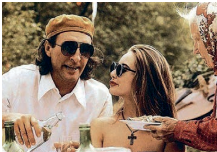
Dědictví aneb Kurvahošigutntág 22.9. 17:30 Studijní a vědecká knihovna PK

prostředí někdejšího Československa, tematizuje snímek Zdeňka Trošky překračování hranic. Těch geografických (Češi s velkou pomocí vyjíždějí do Itálie) i mravních (v Hošticích se rozhodnou založit nudapláž). Oba filmy zasadí do kontextu soudobé tvorby lektorský úvod.