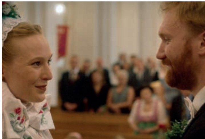
Probuzení do ticha + U nás jí říkáme Hanko 22.9. 11:00 Malý sál, Měšťanská beseda

na programu dvojice dokumentů. Tím krátkým je citlivý dokument o dětských uprchlících z Ukrajiny Probuzení do ticha, tím dlouhým snímek U nás jí říkáme Hanko. Jeho režisérka Grit Lemke se zaměřila na Lužické Srby, nejmenší slovanský národ, jehož představitelé žijí na území Saská a Braniborska. Kolik toho víte o jejich tradicích? Rozhled si můžete rozšířit už hodinu před polednem.