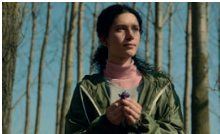
Od marca do mája