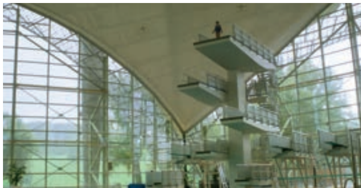
Nakonec všichni zpíváme + Arthur & Diana 24.9. 20:00 JoNáš, Měšťanská beseda