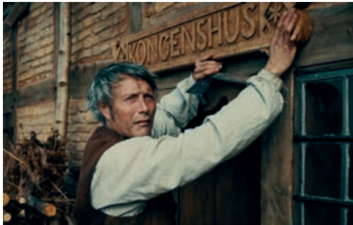
Bastard 25. 9. 20:30 Velký sál, Měšťanská beseda

krajinu. Do cesty se mu ale postaví zákeřný a krutý šlechtic Schinkel. V hlavní roli Kahlena exceluje oblíbený dánský herec Mads Mikkelsen. Kromě osmi dánských filmových cen byl Bastard vyznamenán také třemi „evropskými Oscary“ – Evropskou filmovou cenou –, mimo jiné právě pro nejlepšího herce. Zámecké scény se natáčely na českém zámku Libochovice.